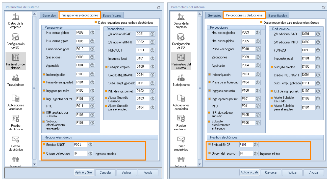
Figura 3 Parámetros del sistema - Pestaña Percepciones y deducciones

☀ En el campo Entidad SNCF , si los ingresos son Federales o Propios indica la clave P001 (Sueldo), si son ingresos Mixtos indica la clave P108 (Recurso Propio).