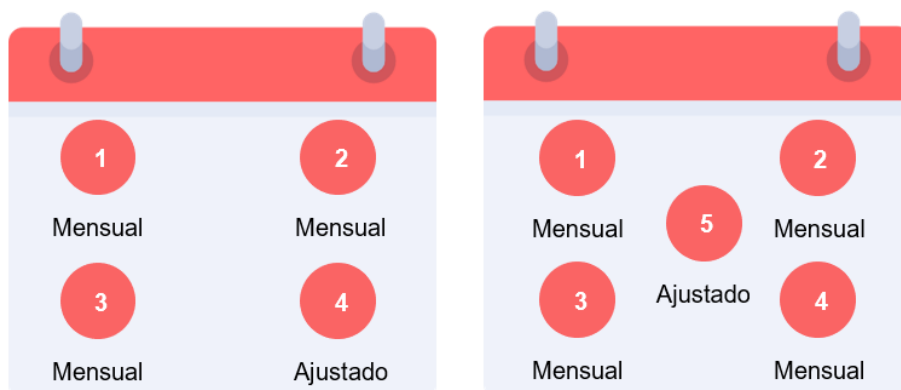
Figura 2 Ejemplo calendario semanal.

Cada círculo representa una nómina en un mes.