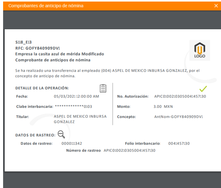
Figura 5.-Comprobante de anticipo.

¡Listo! Con estos sencillos pasos estarás actualizado