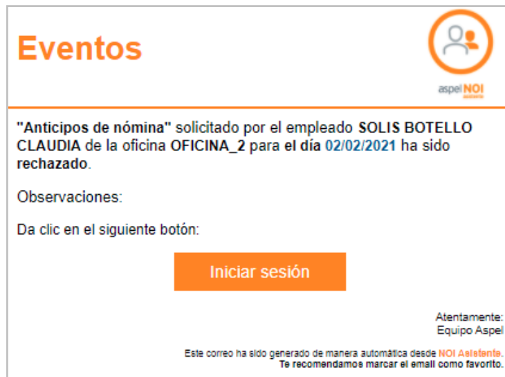
Figura 3.-Notificación al solicitante.

Una vez autorizado o rechazado el evento, se le mandará la notificación al colaborador.